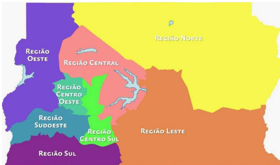
Legenda: Mapa das Regiões de Desenvolvimento Social do Distrito Federal